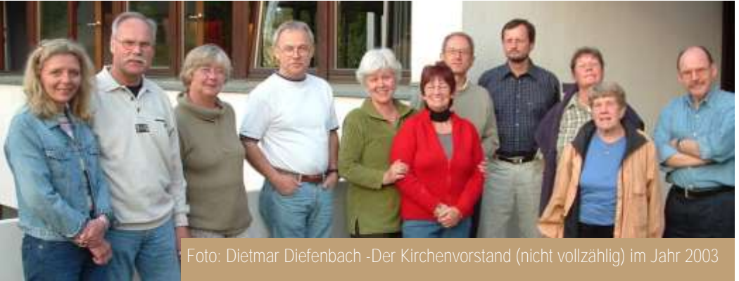
Der Kirchenvorstand (nicht vollzählig) im Jahr 2003

Neben den großen Bauvorhaben, dem Neubau des Gemeindesaals in Ober-Eschbach und dem Anbau der Behindertentoilette und des Stuhllagers in Ober-Erlenbach lag dem Kirchenvorstand insbesondere ein lebendiges Gemeindeleben und ein gutes Miteinander der beiden Gemeindeteile Ober-Eschbach und Ober-Erlenbach am Herzen.