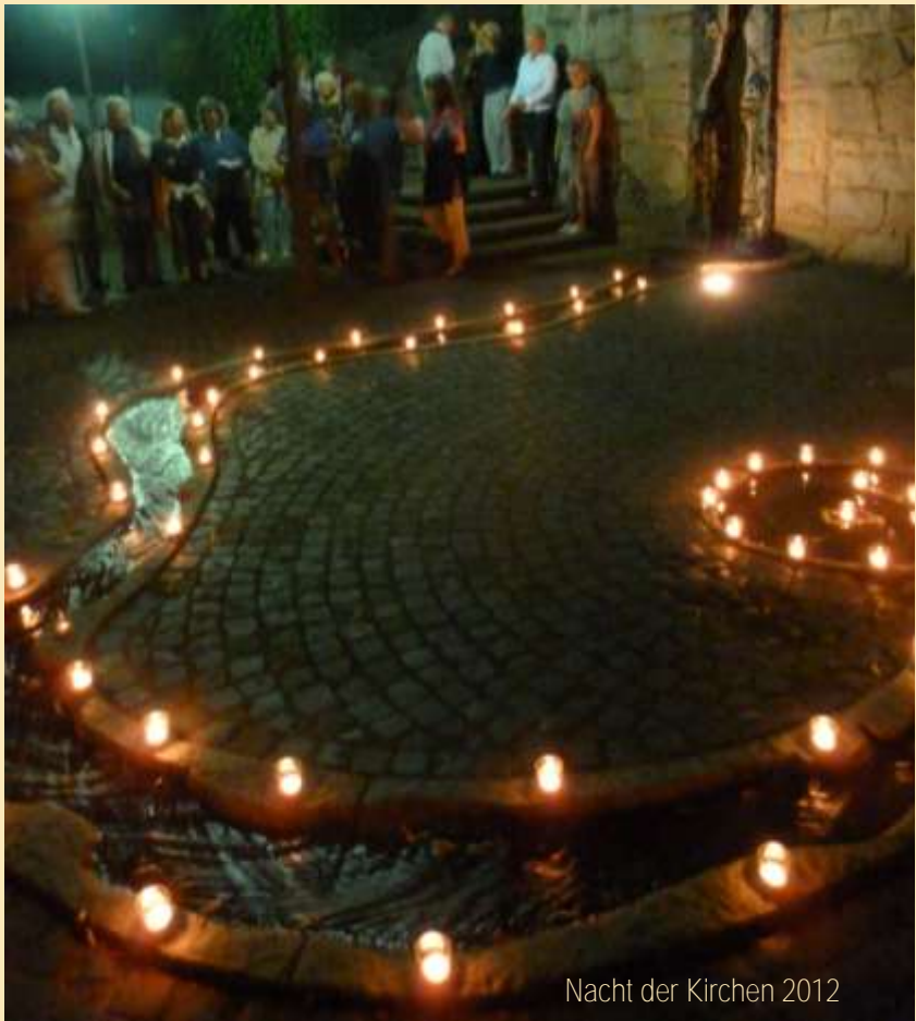
Nacht der Kirchen 2012